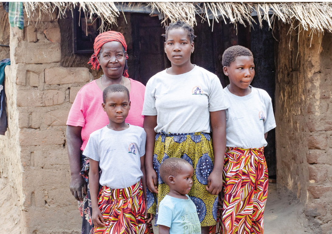
Samarbetspartner: Den lokala organisationen Kubatsirana