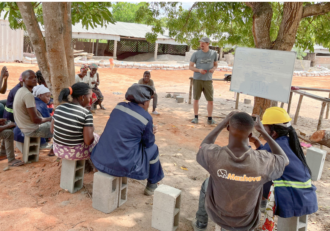
Samarbetspartner: Profuturo, Global Food Garden, Sustainable World Corporation