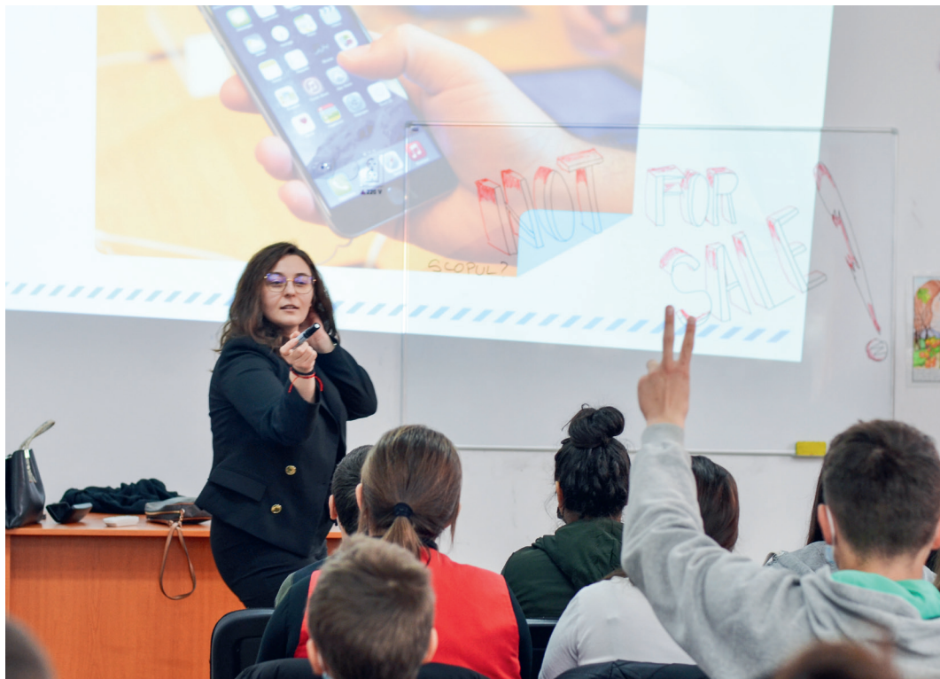
Samarbetspartner: Sam-Hjälp samt den lokala organisationen "Valoare Plus"