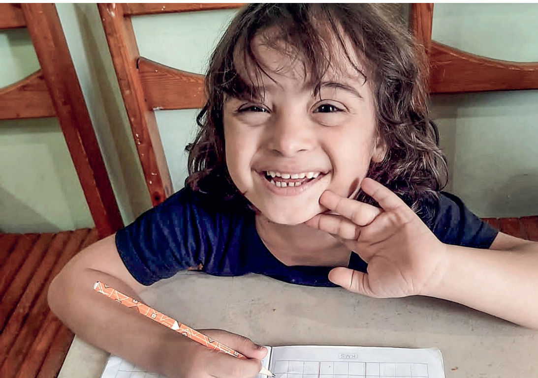
Samarbetspartner: Den lokala församlingen "El Saray"